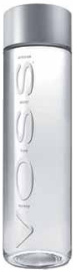
Glass Flat 800 ml