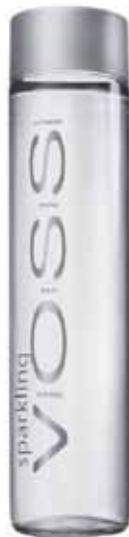
Glass Sparkling 800 ml