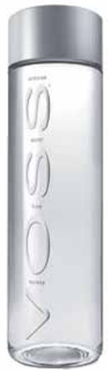
Pet Flat 850 ml